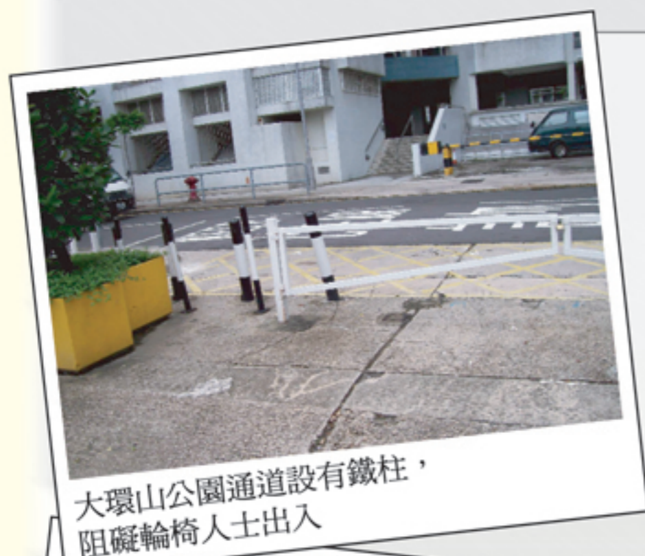
大環山公園通道設有鐵柱，阻礙輪椅人士出入

當然，各位也要第一時間通過1823政府熱線或其他機構的管理公司反映問題，大家一起努力才有機會改變現狀！