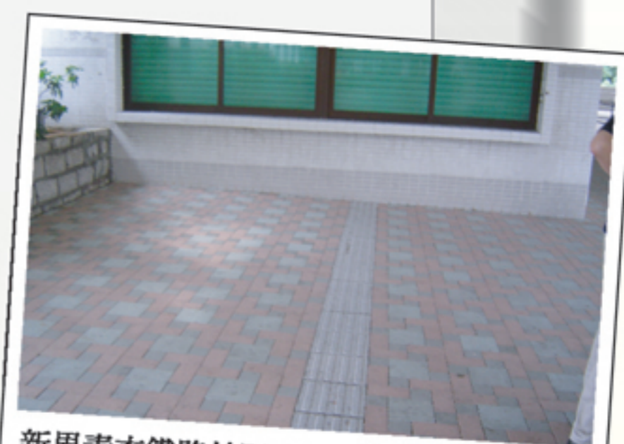
新界青衣鐵路站巴士總站視障人士使用的觸覺引路帶設計錯誤