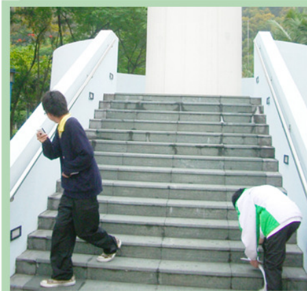
學生忙於調查梯級與樓梯的規格