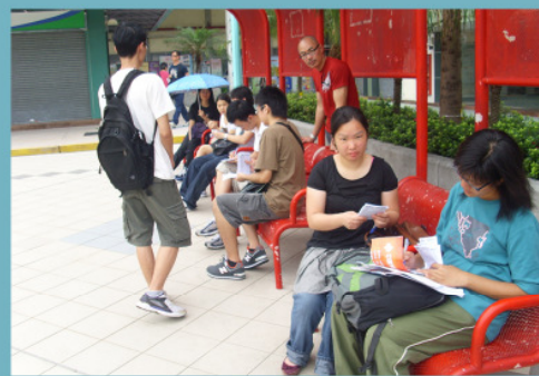
義工們整理調查問卷及資料