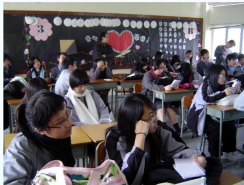
無障礙調查簡介會正在進行

(二) 沙田台山商會中學已於 08 年 1 月 18 日舉行無障礙調查簡介會，將於 2 月 22 日有 45 名學生參與調查活動，屆時將調查沙田新城市廣場一帶及該校附近區域。