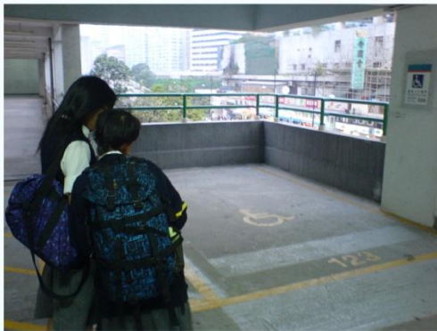
葵涌循道中學學生正在調查停車場

(一) 葵涌循道中學參與本會無障礙調查，已於 07 年 12 月 13 日進行調查活動，有 26 名學生參加，調查地區：葵芳地鐵站、新都會廣場及葵芳邨等地。