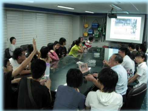
無障礙調查簡介會正在熱烈進行

無實踐機會又忘了，所以倒不如減少訓練內容，及至有服務時，再在之前安排較詳細的簡介會強化訓練，並及時應用在服務上。通過即時實踐，可以更容易更深刻掌握服務技巧。