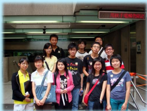
這群年青的義工活潑可愛

無實踐機會又忘了，所以倒不如減少訓練內容，及至有服務時，再在之前安排較詳細的簡介會強化訓練，並及時應用在服務上。通過即時實踐，可以更容易更深刻掌握服務技巧。