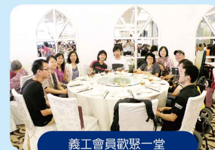
義工會員歡聚一堂