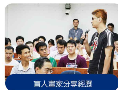
盲人畫家分享經歷

『職』極健行者選舉頒獎典禮將於本年11月12日隆重舉行，屆時將誕生首屆中港兩地十大『職』極健行者，並受到隆重表彰。讓我們熱切期待這一刻的來臨。