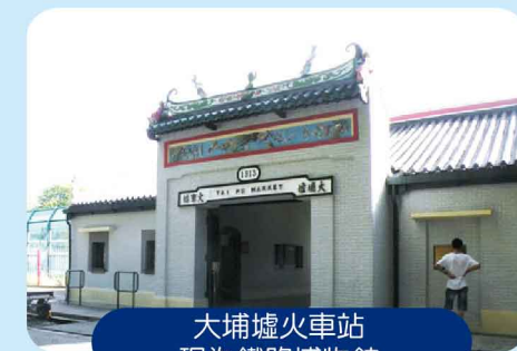
大埔墟火車站 現為鐵路博物館