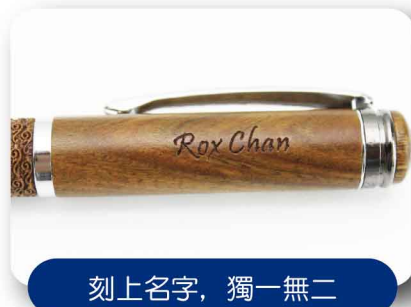
刻上名字，獨一無二

這支殿堂級的禮品筆售價僅為328元，其實您也應把握這難得機會，訂購一支送給自己！