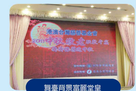
舞臺背景富麗堂皇

參加午宴的大多數都是長者，席間有歌舞表演，主辦單位亦邀請多位大眾所熟悉的演藝界明星擔任表演嘉賓，與大家度過一個開心愉快的中午。