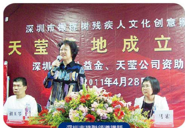
深圳市殘聯領導講話