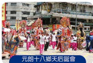
元朗十八鄉天后誕會 景巡中的巡遊隊伍

新一年無障礙調查工作又有新進展，就是西貢區的調查工作已完成。西貢區包括將軍澳新市鎮及西貢半島的郊區部份，範圍頗大，共調查了約一千二百個建築物項目。油尖旺及深水埗兩區的調查工作仍在繼續，兩個區已調查了不少建築物，油尖旺區已超過二千項，深水埗區也達一千多項。而新開展的調查區域為大埔區，大埔是本地近年大力發展的居民區，區內公共屋邨甚多，同時設有很多公園。