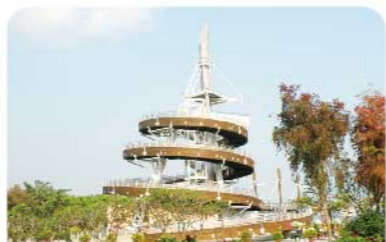
大埔海濱公園的回歸紀念塔 紀念香港回歸

今期遇上天後誕，因此加插介紹元朗的會景巡遊。天後誕是本土特色傳統節慶，本地各區均有不同的慶祝形式，元朗十八鄉天後誕會景巡遊更是歷史悠久、甚具傳統特色的節慶活動。想認識多些新界民俗、傳統、文化，敬請留意日後發表的介紹文章。