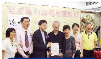
高永文醫生為義工力量頒獎

2011年05月28日晚，本會友好團體—香港義工力量主辦的「義工力量·全家傳心頌親恩暨聚餐」活動於深水埗西九龍中心龍庭酒樓隆重舉行，活動得到深水埗區議會撥款贊助。