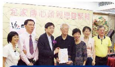
高永文醫生為義工力量頒獎

2011年05月28日晚，本會友好團體—香港義工力量主辦的「義工力量·全家傳心頌親恩暨聚餐」活動於深水埗西九龍中心龍庭酒樓隆重舉行，活動得到深水埗區議會撥款贊助。