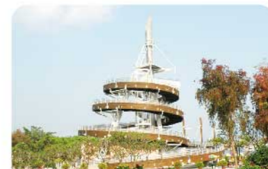
大埔海濱公園的回歸紀念塔 紀念香港回歸

今期遇上天後誕，因此加插介紹元朗的會景巡遊。天後誕是本土特色傳統節慶，本地各區均有不同的慶祝形式，元朗十八鄉天後誕會景巡遊更是歷史悠久、甚具傳統特色的節慶活動。想認識多些新界民俗、傳統、文化，敬請留意日後發表的介紹文章。