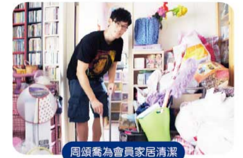
周頌喬為會員家居清潔