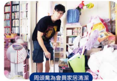
周頌喬為會員家居清潔