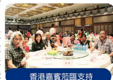
香港嘉賓蒞臨支持