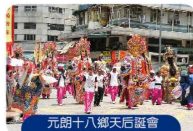
元朗十八鄉天后誕會 景巡中的巡遊隊伍

新一年無障礙調查工作又有新進展，就是西貢區的調查工作已完成。西貢區包括將軍澳新市鎮及西貢半島的郊區部份，範圍頗大，共調查了約一千二百個建築物項目。油尖旺及深水埗兩區的調查工作仍在繼續，兩個區已調查了不少建築物，油尖旺區已超過二千項，深水埗區也達一千多項。而新開展的調查區域為大埔區，大埔是本地近年大力發展的居民區，區內公共屋邨甚多，同時設有很多公園。