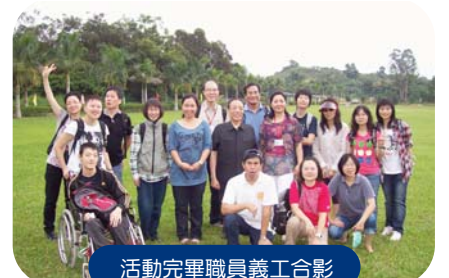
活動完畢職員義工合影