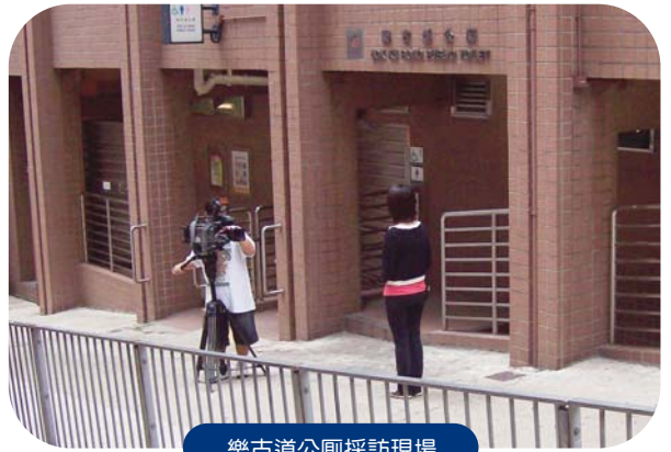
樂古道公廁採訪現場