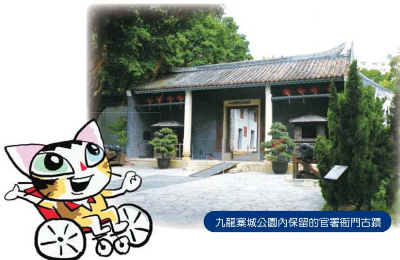
九龍寨城公園內保留的官署衙門古蹟

至於「無障礙搜尋」方面，九龍城區已完成的分區有嘉道理及太子道西；觀塘區方面，坪石、牛頭角、四順、秀茂坪、翠屏、月華街、功樂及樂華等分區已完成調查。已調查建築物總計有16,680項，已調查的無障礙設施有64,535項。