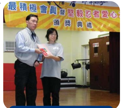
貓貓(右)領取「堅毅忍者愛心大使」獎