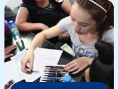
網友們選購禮品筆