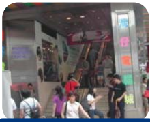
灣仔電腦城假期無門而入