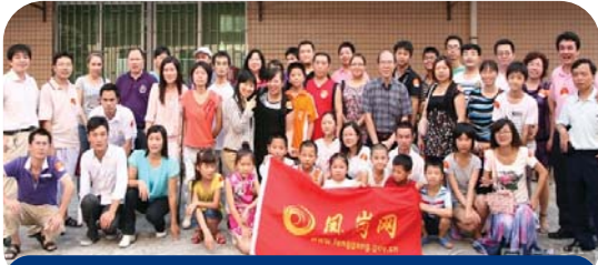
東莞鳳崗網網友組團探訪大陸分會禮品部同事及團購禮品筆

鳳崗網是東莞鳳崗鎮政府的官方網站，七月底鳳崗網組織了一個網友探訪團，帶同鎮電視台記者到本會大陸分會旗下的堅毅忍者禮品公司探訪。有關探訪的報道在7月27日鳳崗電視新聞播出。下面是轉載報道的摘要：