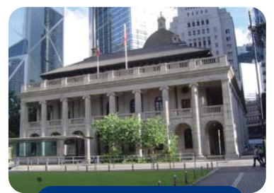
矗立在中環鬧市的立法會大樓