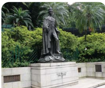
位於香港動植物公園內的英王喬治六世銅像

至於「無障礙好去處」，最近介紹的是香港動植物公園與中環皇后像廣場的景點。香港動植物公園是香港最早的公園，中環皇后像廣場亦是香港開埠早期興建的公眾廣場，與後來建成的立法會大樓、遮打花園與愛丁堡廣場等，均是人們假日消閒休憩的好去處。這些景點兼具歷史、文化與保育的元素，位於中環金融及商業中心區內，可說是一個多元化的遊覽景點！