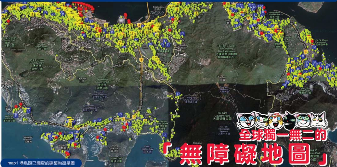
map1 港島區已調查的建築物衛星圖

本會自2007年5月正式展開全港十八區的無障礙調查，就是在全港展開一種地氈式（俗稱洗街式）調查，將所有存在於地面的建築物及公共設施包括：商場、港鐵站、巴士總站、隧道、天橋、公園、遊樂場、街市、體育館、圖書館、學校、醫院及診所、銀行、酒樓及快餐店、住宅（公屋及私人住宅）、工廠大廈等等作為調查對象，實地拍照及文字記錄，然後再整理上網，圖文並茂顯示在本會網頁，無償供傷殘人士、長者和其他有需要者使用。這是一個在香港乃至全世界都史無前例的大行動，是一個攝人心魄的大行動！試想，香港雖然不大，但讓人徒步走遍它的每個角落已是奇迹，更別說單憑本會兩名職員，憑著雙腳，爬山涉水、克服惡劣天氣和人為阻撓，無論嚴寒酷暑春夏秋冬都堅持不懈的外出調查，還要象狗仔隊一樣機智靈活，才取得每一項資料，更花費了大量心血，克服長期對住電腦上載資料的枯燥乏味和視覺疲勞，終於取得了驕人成績！到目前為止，港島區調查已進入尾聲，現已正式展開九龍區的調查，至今已調查的建築物項目是：11819項，無障礙設施是：49295項。