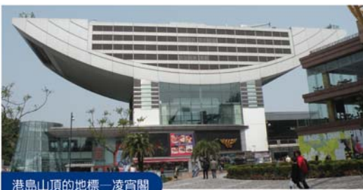
港島山頂的地標——凌霄閣

吉道等。如想瞭解山頂的歷史與好玩的地方，就不要錯過今期的介紹了。至於之後好去處的文章，會著重介紹港島的文化古蹟，介紹的景點分散在上環、中環與灣仔各處。香港島是本港最早開埠的地區，遺下的古蹟與歷史掌故很多；潮流與懷舊、集體回憶，不妨讓好去處權充「時光隧道」，重新展現港島昔日風情，發一番思古之幽情。懷舊篇第一章是介紹港島古蹟建築物集中地、兼具學術重鎮的香港大學。