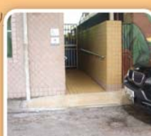
堅拿道公廁之殘廁投訴前