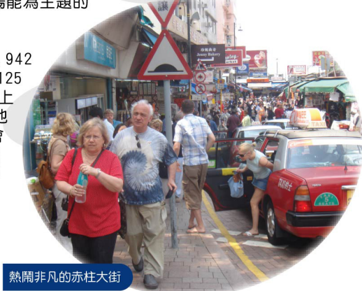
熱鬧非凡的赤柱大街

截至目前，已調查建築物10,942項，已調查的無障礙設施亦有46,125項。我們已將調查過的建築物項目上載至Google地圖，只要在Google地圖網頁搜尋相關的資料，便有機會見到我們的調查資料。目前，我們網站的「無障礙搜尋」欄目平均每日都有3000-5000的瀏覽人次，實在是一個好事情！我們的調查資料能夠發揮作用，我們的辛苦沒白費！