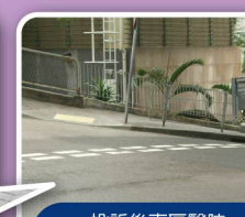
投訴後東區醫院入口增設下斜路緣