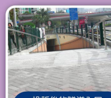
投訴後的隧道入口，鐘平及加闊不少