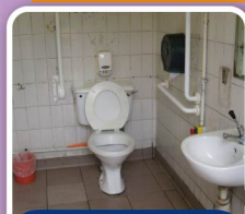
投訴後港澳碼頭公廁 (殘廁) 增設摺合式扶手