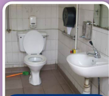
投訴前港澳碼頭公廁 (殘廁) 無摺合式扶手