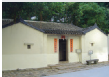
位於柴灣的羅屋民俗館正門