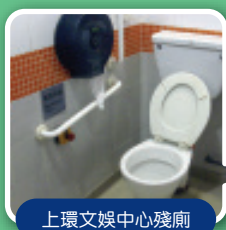
上環文娛中心殘廁