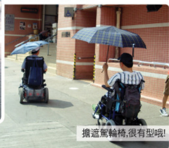
擔造駕輪椅,很有型哦!