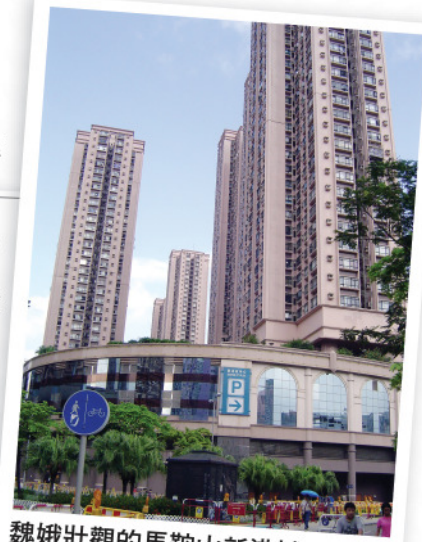
魏娥壯觀的馬鞍山新港城