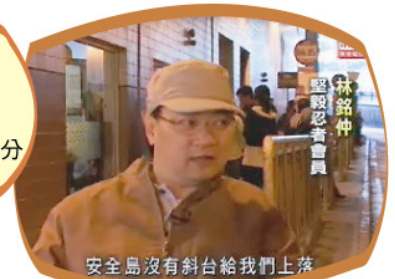
安全島沒有斜台給我們上落

亞視本港台：一月十七日(星期六)下午七時正 亞視國際台：一月三十日(年初五)下午六時五十五分 無線台：一月三十一日(年初六)凌晨二時正